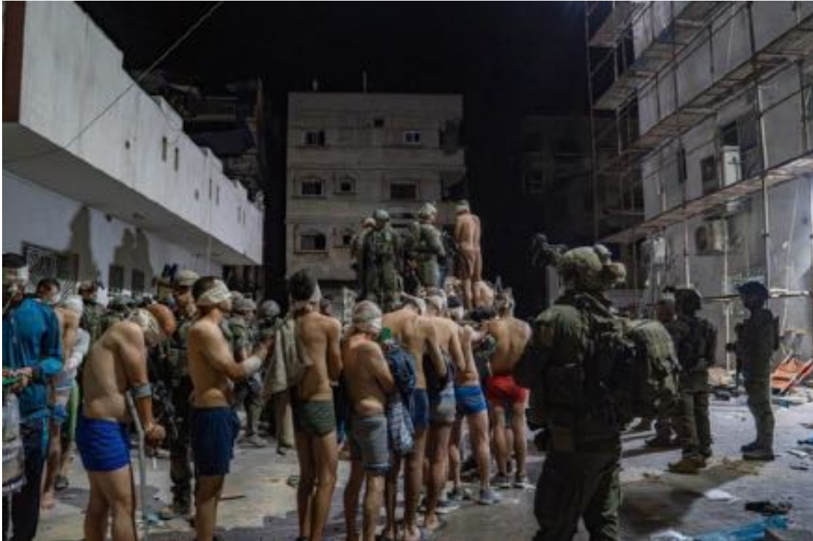
La foto che immortalava i crimini israeliani, per gentile concessione dei criminali stessi.

Un mese fa l'esercito israeliano ha direttamente invaso armi in pugno l'edificio , ha distrutto o sequestrato tutte le ambulanze danneggiando pesantemente la struttura e, per buona misura, ha prelevato, incappucciato, picchiato e portato via molti pazienti e quasi tutto il personale medico ( dei quali non si sa più nulla ). La foto qui sotto, orgogliosamente postata dall'account Twitter gestito dal Mossad come segno di vittoria, mostra il cortile dell'ospedale con una fila di persone anziane, con grucce e flebo ancora attaccate al braccio, obbligate a restare praticamente nude di notte e al freddo in attesa di essere deportate verso luoghi di prigionia e tortura.